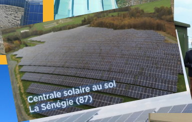
Centrale solaire au sol La Sénégie (87)